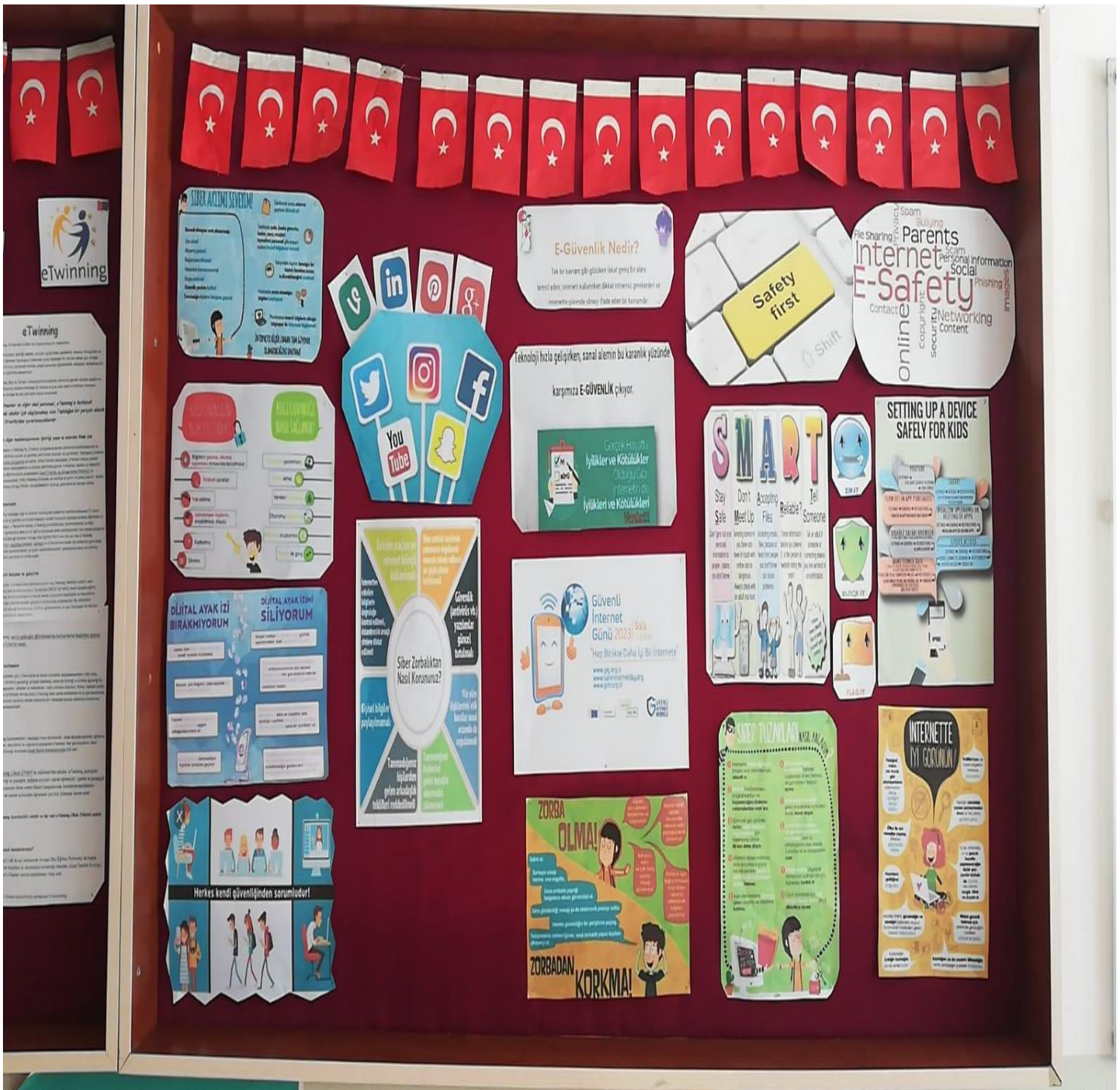
A secure internet board was prepared by the eTwinning school social club.